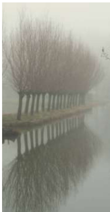
Bomen langs de wetering, achteraan de ijsbaan. Roerloos in de mist.