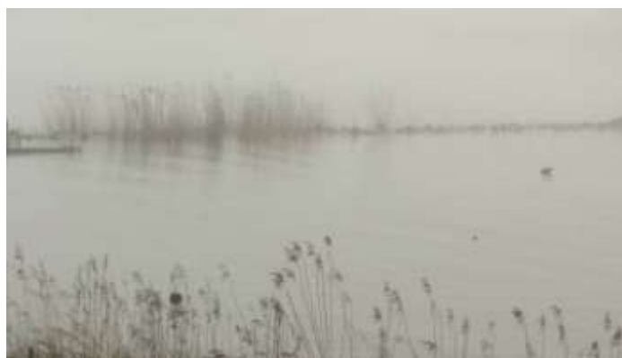
De Merwede bij mist