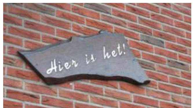
Niet mis te verstaan!

Eén ervan was het runnen van een houthandel in Bleskensgraaf. Om zijn bedrijf goed onder de aandacht de brengen, plaatste Klaas aan de gevel van zijn huis en aan de Graafstroom er tegenover een bord met de welluidende tekst: 'Hier is het, hier bent u bij Maat'. Dat was in 1970. Een kleine dertig jaar later verhuisde het paar naar Hardinxveld. Een ander dorp, een ander huis, maar met (bijna) dezelfde naam: 'Hier is het', opgetekend op een eikenhouten plank, afkomstig uit de voormalige houthandel. De laatste jaren komt deze aanduiding weer goed van pas. Maat verzamelt nl. oud ijzer en flessendopjes voor het goede doel. In 7 jaar tijd wel liefst 328.000 kg ijzer, goed voor € 97.500 en 8000 kg doppen, wat € 2000,- opleverde! Ieder die bij hem oud ijzer brengt, weet meteen: hier is het!