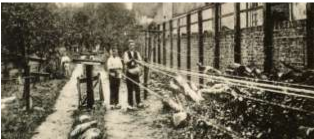
Druk 'in touw'

De touwslager deed zijn werk in de open lucht, overdekt of in een tentachtig geheel, op een touwslagerij of lijnbaan: een soms wel 300 meter lange, smalle strook grond waarboven vele door een spinner aangeleverde garens, werden uitgeschoren (uitgelopen). Het touw kwam terecht in een "kuil", een nog steeds bestaande lengtemaat voor touw. Aan een van de uiteindes van de lijnbaan werden de garens in groepjes aan de haken van een wiel of slagmechanisme (slinger) bevestigd, aan iedere haak een groepje garens. Daar stond ook een teer- en drooghuis.