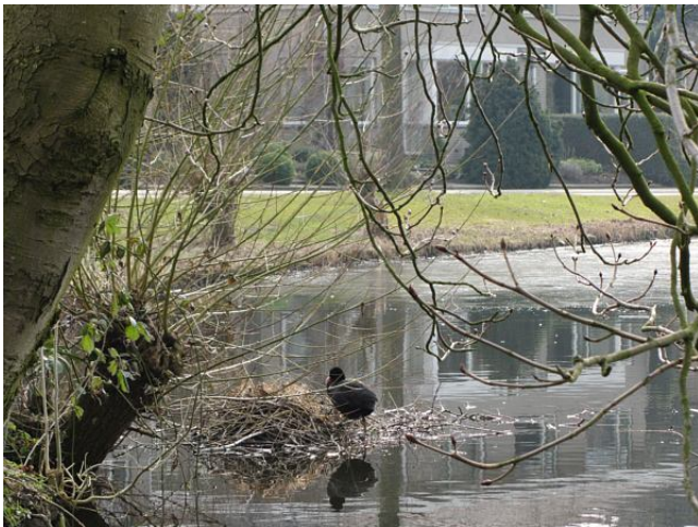
Het is de hoogste tijd om aan een nest te gaan bouwen. Brrr!

WILT U DE NIEUWSBRIEF OOK GRATIS ONTVANGEN?