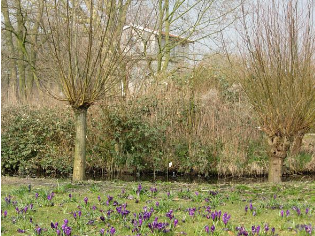
De lente komt eraan... volgens deze krokussen.