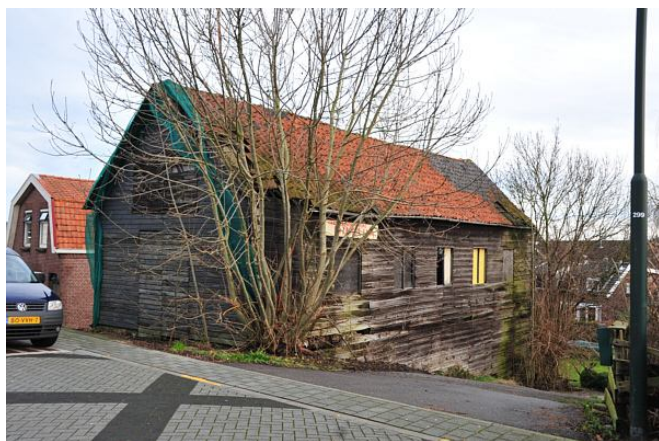
Mooi zo'n door gebrek aan onderhoud verweerde schuur.