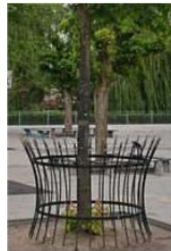
Zo hoort het...