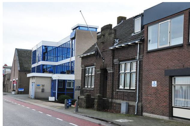
Smaken verschillen; twee keer mooi en twee keer ... minder mooi!

Bijna allemaal verdwenen. De restanten van bedrijven langs de dijk. 25 jaar terug stond er nog best wat. Het kon geen weerstand bieden aan de vooruitgang. Want dat is het wat ons mensen drijft: altijd maar streven naar iets meer, iets anders, iets beters. In elk geval iets wat we niet kennen en waarvan we ons niet kunnen indenken wat het effect zal zijn. We plannen van alles, we denken na, we schetsen, we ontwerpen. Maar zeker weten doen we het pas als het er is. Of juist als het er niet meer is. Dat geldt zeker voor de kleine stukjes resterend erfgoed.