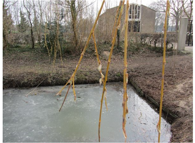
Met de sporen van de winter op het land en ijs in de sloot ontp(rop)pen de katjes zich uit hun warme behuizinkjes.