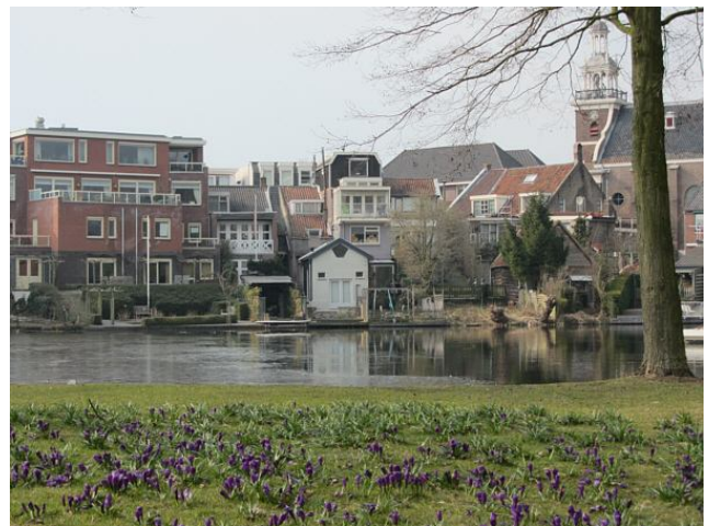
De welvaart en de lente vechten om een plekje rond de wiel.