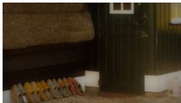
Een kiekje, geschoten op een winterwandeling langs de molen