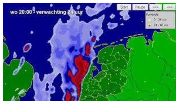
Robberig weer op komst!

Een term die je overigens niet vaak meer hoort. Als kinderen moesten wij lachen als mijn vader hem gebruikte. En zo onder elkaar hebben wij het gekscherend nog wel eens over 'robberig weer', maar tegen een vreemde zeg je dat niet gauw. Een ouderwetse uitdrukking.