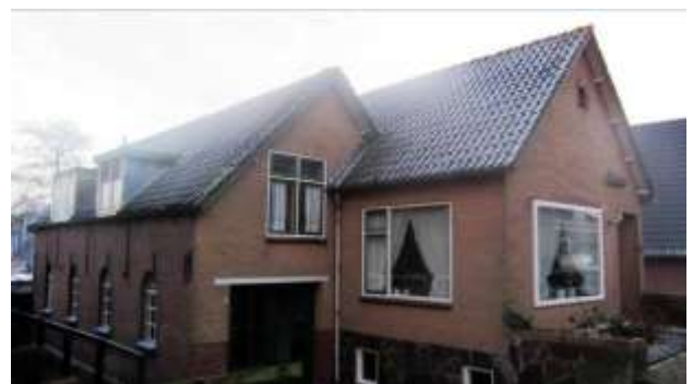
Links de oude hoepmakersschuur en rechts het nieuw gebouwde gedeelte van 'Orana'