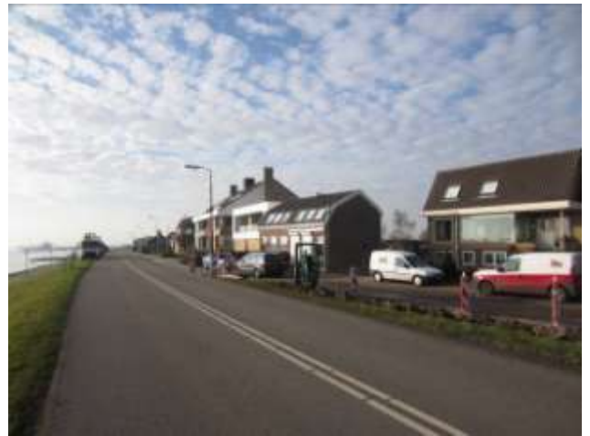
Geen welstandstoezicht meer: een reden voor bezorgdheid

Thans is het in het kader van de verdere liberalisering van de overheidsbemoeienis overboord gegooid. Stichting Dorpsbehoud vindt het jammer dat het zo is gelopen. Daar komt nog bij dat wij destijds schriftelijk hebben gereageerd op de plannen tot afschaffing. Helaas hebben we uit de krant moeten vernemen dat de raad dit heeft besloten. Een reactie op onze brief hebben we tot op heden nog niet gezien.