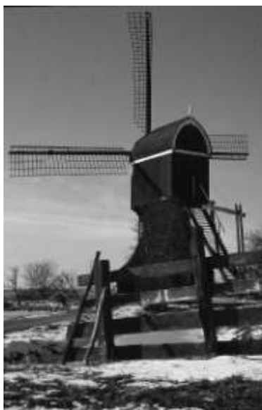
Ook in de winter prachtig!

En een prachtig onderdeel van een mooi 'ronde polder', dat in alle seizoenen aantrekkelijk is.