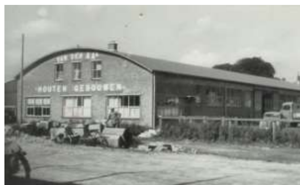
Van der Aa's Houten Gebouwen

Rechts in de Troelstrastraat was een klein bedrijventerrein. Daar waren twee ketenbouwers gevestigd, Van der Aa en Van 't Verlaat. Giessendam kende heel wat bedrijven in die branche. Ze waren ontstaan, toen de hoepelmakerijen niet meer rendeerden. Aan houten keten kwam behoefte in de aannemerij. Overal waar gewerkt werd waren verblijfsruimten, als kantine, als kantoor of als wat anders, nodig.