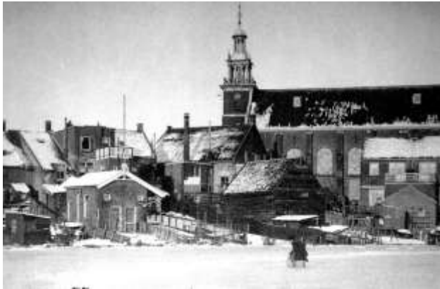
Karakteristiek plaatje; het landschap van een dorp

Eeuwenlang hebben mensen op deze plaats gewerkt, gewoond, gebouwd, gegraven, geplant en zo het landschap een eigen gezicht gegeven.