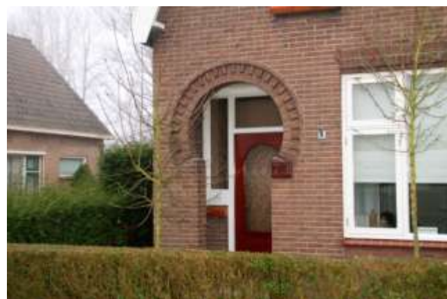
Sleutelgatportieken in de Peulenstraat (2x), Damstraat en Binnendams