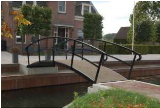
Nieuw naar oud model, een fraai gezicht!