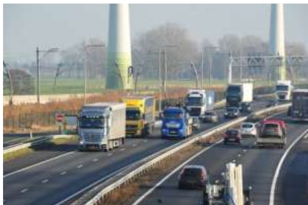
Bijna aaneengesloten verkeer

Helaas wordt het zicht op 'naast de rijksweg' op heel veel plaatsen ontnomen door lelijke schermen. Behalve dat ze lelijk zijn, zijn ze ook smerig. Schoonmaken is er niet meer bij sinds het rijk in zijn korte termijnfilosofie denkt dat je met bezuinigen geld over kunt houden. Ook de graffiti heeft zijn intrede gedaan op de schermen. 'Gekken en dwazen schrijven hun namen op deuren en glazen', zeiden de mensen vroeger.