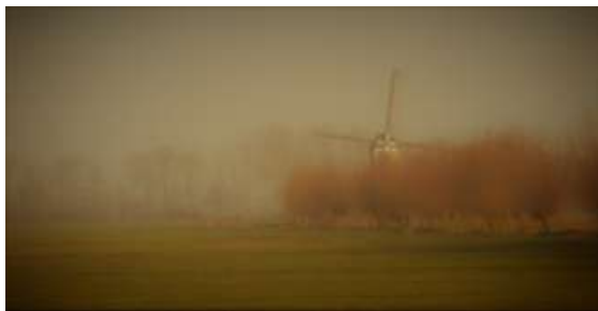
De Tiendwegse molen in winternevelen gehuld

WILT U DE NIEUWSBRIEF OOK GRATIS ONTVANGEN?