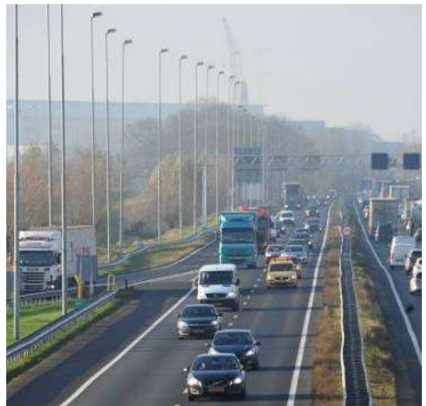
Druk verkeer op de A15

Bijna elke morgen schreeuwt Radio Rijnmond de ether in dat er een file staat bij Hardinxveld-Giessendam: van Hardinxveld-Giessendam tot aan Sliedrecht-West, of van Arkel tot Hardinxveld-Giessendam. Ooit was het dijkdorp sporadisch in het nieuws: alleen als er iemand van het koninklijk huis of een andere hoogwaardigheidsbekleder een belangrijk schip kwam dopen op een van de werven. In die tijd was die rijksweg nog goed begaanbaar. Er was ruimte genoeg voor iedereen. De hele dag door. Bij de Sluisweg en bij de Buldersteeg (de latere Koningin Wilhelminalaan) waren gelijkvloerse kruisingen, waar je gewoon de rijksweg over kon steken. Ook op de fiets of te voet. Even goed uitkijken! Eerst naar links kijken, dan rechts en dan nog een keer links. En als er niets aan kwam, kon je over.