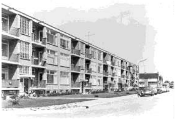
Zogenaamde portiekflat aan de Maasstraat

zwoegend zijn weg was vervolgd, zag ik geen op elkaar lijkende huizen. Ik ervoer een stuk geschiedenis.