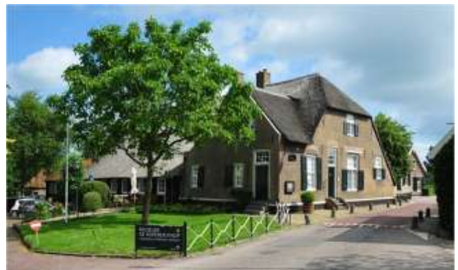
Vroeger boerderij, nu museum: De Koperen Knop

Dat houdt soms in dat er nieuwe bestemmingen gezocht worden voor monumentale gebouwen, zoals een museum in een oude boerderij, een winkel in een karakteristiek woonhuis, een café-restaurant in een stationsgebouw.