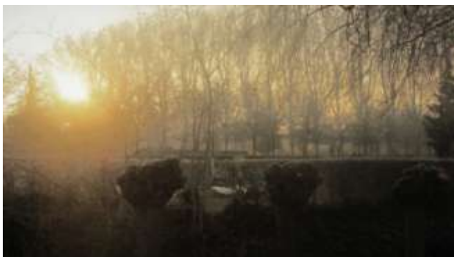
Winterzonnetje boven de begraafplaats