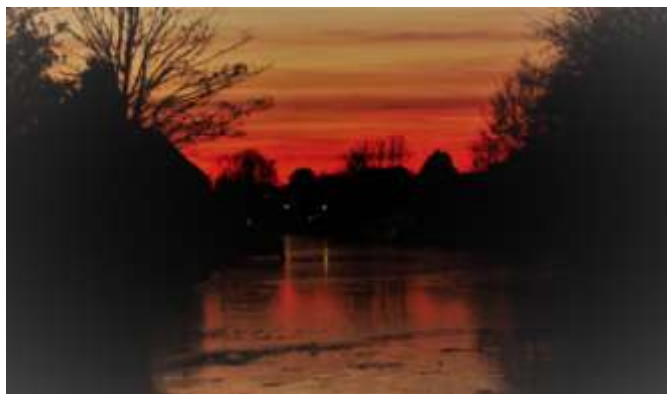
Laat winterzonnetje boven de Giessen