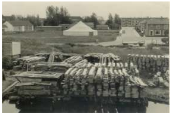
Stapels gewaterd hout

Links naast de zuidelijke oprit van de brug droogde mijn opa in het eerste stuk Peulen zijn in het verderop gelegen balkengat gewaterde hout. Keurig stonden de tot planken gezaagde bomen opgestapeld. Op die plek was nog vroeger een zwembad in de Giessen.