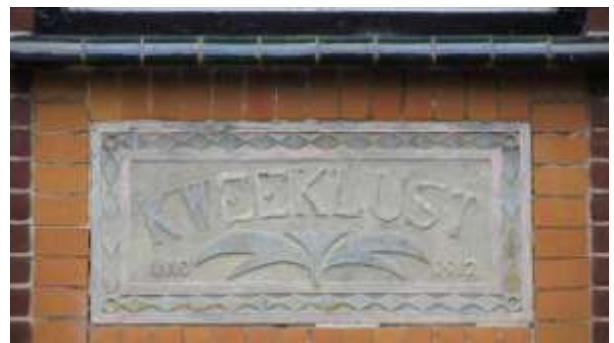
De gevelsteen boven de voordeur

Er zullen niet veel Hardinxvelders zijn die het pand op Parallelweg 19 niet kennen. Een fraai, statig huis, gescheiden van de weg door een brug en heuse oprijlaan omzoomd door mooie oude bomen. Een van de laatste juweeltjes in ons dorp. Minder bekend misschien is de naam die op een gevelsteen ingemetseld boven de voordeur prijkt: Kweeklust.