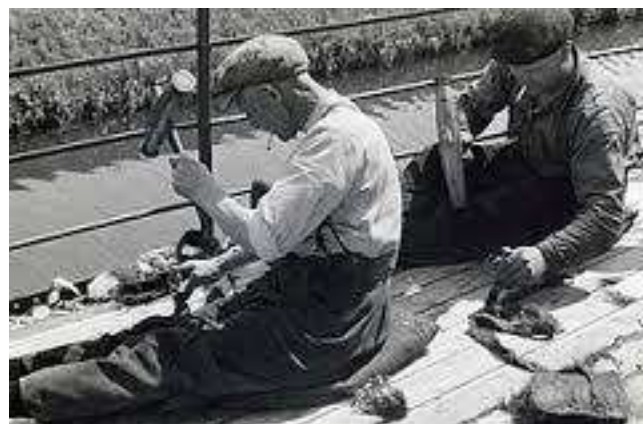
Het opkalfateren van een boot

men het werken van het hout. Door het werken van het hout zullen er kieren tussen de planken ontstaan en zal het schip gaan lekken en zinken. Om dit lekken te voorkomen werden de naden tussen de gangen opgevuld met geteerde hennepvezels. Deze vezels werden 'het werk' genoemd. Behalve hennep werden soms ook mos, papier of oude kranten toegepast. De vochtige omgeving deed het werk zwellen, waardoor het zich goed in de naden vast zette en de dichting nog beter werd. De kieren die met werk opgevuld werden heetten de breeuwnaden. Wanneer het breeuwwerk te oud werd, werd het te stug en verloor de hechting met het aanliggende hout en de naad begon te lekken. Wanneer pompen dan niet meer hielp werd het hoog tijd om het schip te hellingen en op te kalfateren: van nieuw breeuwwerk laten voorzien.