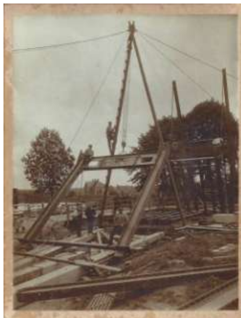
Hollandse trots: de bouw van een nieuwe brug bij de monding van het kanaal

ben gezegd. Dat dit wel is vastgelegd heeft alles te maken met nieuwsgierigheid, stond laatst in een landelijk dagblad te lezen. De bouw van een brug is een combinatie van eeuwenoude Hollandse ingenieurstraditie en moderne inzichten. Een daar zijn we in Nederland heel trots op. Dat bewonderen we.