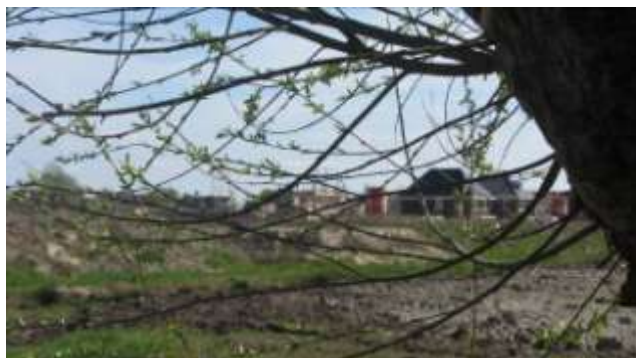
Een nieuw seizoen, een nieuwe wijk: Tienmorgen in aanleg

Ver voordat de nabij gelegen wijk Tienmorgen in ontwikkeling werd genomen heeft de gemeenteraad van Hardinxveld-Giessendam al besloten dat de straatnamen in deze nieuwe wijk de herinnering aan de riviervisserij hoog moesten houden, een branche die ooit voor veel welvaart zorgde in het Boven-Hardinxveld van rond 1900. Wie weet bijvoorbeeld nog wat een breeuwplaats was? Dat het een zandplaat was waar men de boten liet droogvallen om de naden tussen het hout dicht te breeuwen? En wat breeuwen eigenlijk is? Een lesje over houten vissersboten: hout zet uit als het nat wordt en het krimpt weer als het droog wordt. Dit noemt