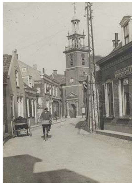
De Peulenstraat in vroeger dagen

Hier worden klinkers gebakken i.p.v. lucht!"