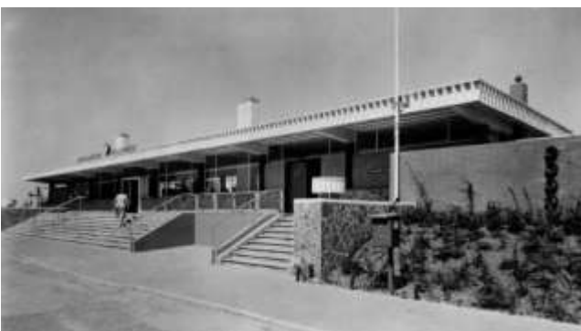
Het stationsgebouw rond 1960 met tussen de trappen de los-/en laadplaats

Peter, dank je wel voor deze waardevolle aanvullende informatie!