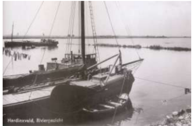
De omslagfoto van 'Oud Hardinxveld-Giessendam' op facebook

Tip: wordt ook lid van de facebook-groep; hierop kun je ook zelf oude foto's en herinneringen delen met anderen.