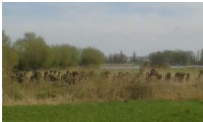
Uitbottend groen langs de rivier