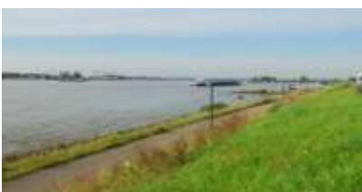
De rivierdijk anno 2015

Dan zou de 'Boven' variant dus de oudste zijn. Kijken wij naar ons dorp, dan zien we ook iets dergelijks. Hardinxveld is een van de oudste dorpen van de Alblasserwaard, waar al in 1105 een pastoor, dus ook een kerk, was. Deze kerk stond op de Boven-Hardinxveldse Buurt. Het centrum van Hardinxveld was vroeger dan ook in 'Boven', terwijl 'Neder' aangroeide tegen de dam in de Giessen.