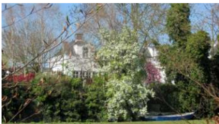
Aan de Vecht of aan de Giessen? Het is Buitendams vanaf de achterkant