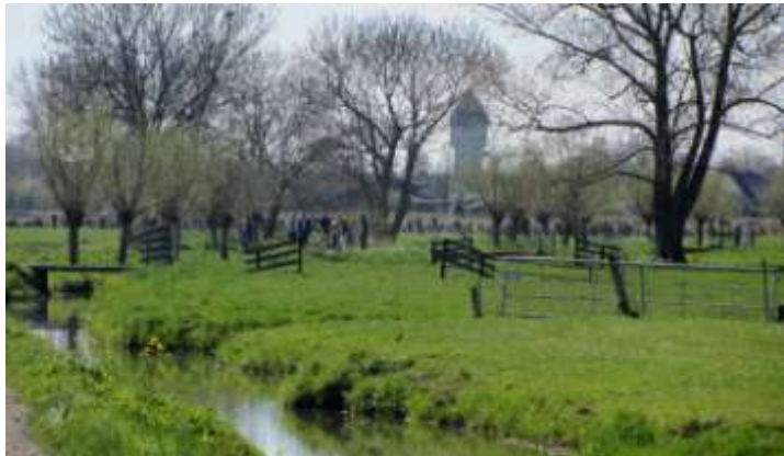
De Tiendweg in Boven-Hardinxveld nodigt uit tot een mooie voorjaarswandeling