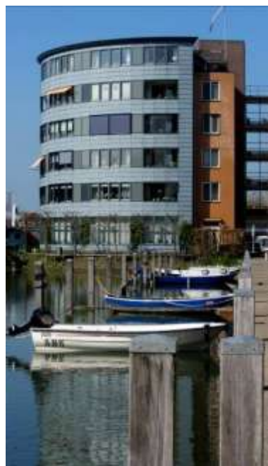
Wachtend op het vaarseizoen

WILT U DE NIEUWSBRIEF OOK GRATIS ONTVANGEN?